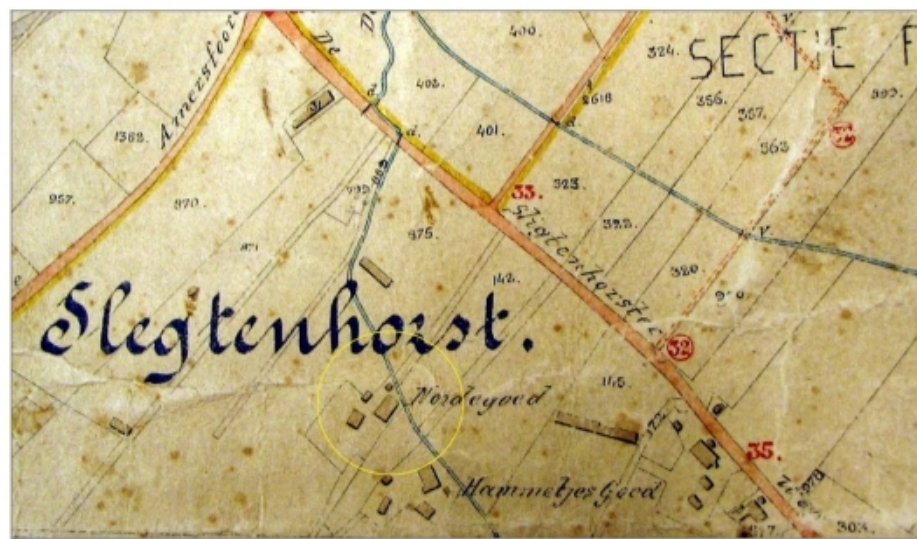
Fig. 106 Woonkaart van Gemeente Nijkerk uit 1893.